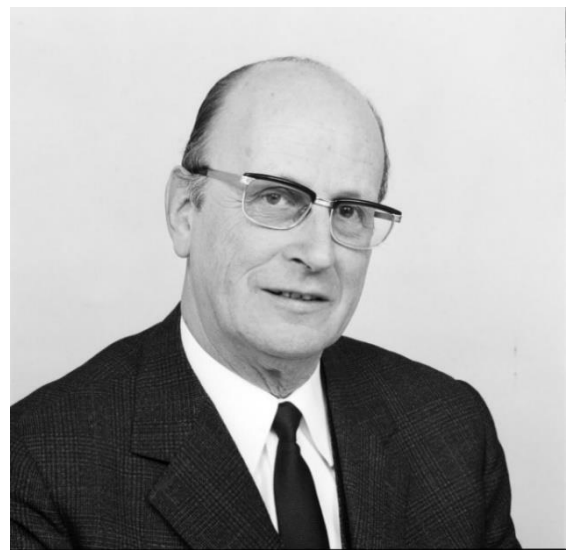
Ein Foto aus dem Jahre 1970, als er CDU-Politiker war.

Im Osten haben wir nur selten kapituliert, denn wir wussten von Augenzeugen, dass die Bolschewiken SS-Männer töteten, sobald sie sich ergeben hatten. Soweit ich weiß, haben sie damit geprahlt. Wir hatten keine Befehle, keine Gefangenen zu machen, und taten dies immer und behandelten sie fair. Als Beweis dafür habe ich gesehen, wie viele ehemalige Feinde zu uns kamen, um in unabhängigen Brigaden und Regimentern für uns zu kämpfen. Sie haben an der Front sehr gut gekämpft, aber unsere Führung hat sich verrechnet, als sie einige nach Westen schickte und andere zum Kampf gegen Partisanen einsetzte. Dem hatten sie nicht zugestimmt. Auch hier gab es Reibereien zwischen der Wehrmacht und der SS. Die Polen und Russen wollten die Bolschewiken bekämpfen, nicht die westlichen Verbündeten oder die Partisanen. Soweit ich weiß, waren sie im Kampf gegen die Partisanen sehr grausam zu ihnen und ihren Familien. Zusammenfassend lässt sich sagen, dass die SS Respekt vor der Wehrmacht hatte und sie als Kameraden betrachtete; die meisten in der Wehrmacht sahen das schließlich genauso. Am Anfang war das nicht so, sie fürchteten eine politische Armee, die nicht unter ihrer Kontrolle stand. Sie müssen auch wissen, dass einige wenige Männer in der Wehrmacht sich Hitler widersetzen, sie waren die Juli-Verräter.