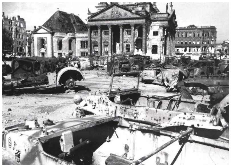
V- Schwimmwagen der Nordland. Einer mit der taktischen Kennzeichnung des (motorisierten) Divisionshauptquartiers. Das Foto wurde im Juli 1945 am Gendarmenmarkt in Berlin-Mitte aufgenommen, mit dem Deutschen Dom im Hintergrund.

Die Überlebenden der 11. SS-Freiwilligen-Panzergrenadier-Division Nordland unter dem Kommando von SS-Brigadeführer Dr. Gustav Krukenberg hielten gegen eine überwältigende Übermacht stand, als sie in Berlin eingeschlossen waren. Am 30. April 1945 wurde ihnen mitgeteilt, dass diejenigen, die dazu in der Lage waren, nach Westen ausbrechen sollten. Der Ausbruch aus der Reichskanzlei und dem Führerbunker begann um 23:00 Uhr am 1. Mai 1945. Die Durchbruchroute begann an der Weidendammer Brücke und verlief weiter nordwestlich entlang der Friedrichstraße. Der Durchbruch geriet ins Stocken - Zivilisten und Soldaten wurden vom sowjetischen Feuer niedergemäht. Einige kleine Gruppen schafften es, die Amerikaner in Charlottenburg zu erreichen, aber viele andere nicht, darunter die 3. Kompanie (schwedisch) der SS-Panzer-Aufklärungs-Abteilung II, die einen verzweifelten und letztlich nutzlosen Kampf um die Flucht vor den umliegenden Sowjets führte. Die wenigen Freiwilligen der Waffen-SS aus dem Nordland, die sich der sowjetischen Roten Armee ergaben, wurden nach Osten geschickt, die meisten wurden nie wieder gesehen.