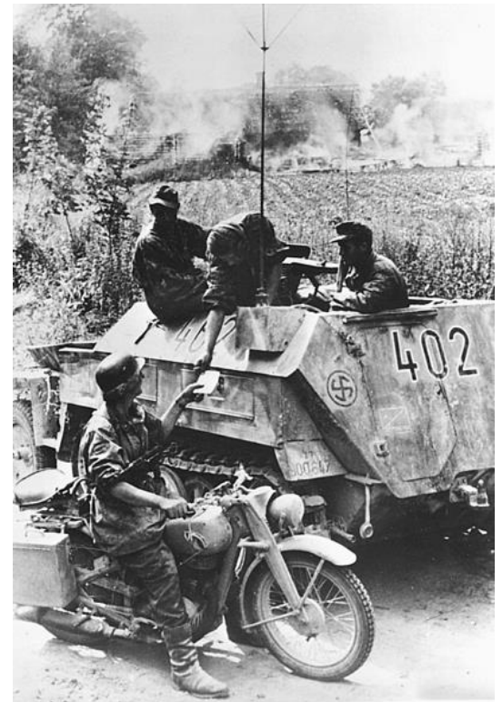
Ein Motorradkurier meldet sich bei der Besetzung eines Sd.Kfz. 250/5 Aufklärungszuges der Division Nordland. Dieses Foto wurde im Juli 1944 aufgenommen, als die Sowjets eine Reihe von massiven Panzerangriffen gegen den Narva-Brückenkopf starteten. Die Nordland-Division mit der estnischen und der niederländischen Division leistete erbitterten Widerstand. In einer Schlacht schalteten sie zum Beispiel mehr als 100 T-34 aus, die ihre Linien angriffen.