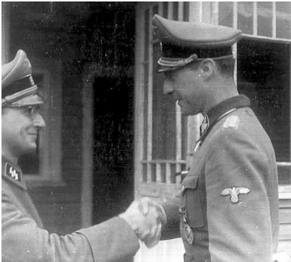
III. SS-Panzer-Korps Verleihungszeremonie in Sillamäe (Estland) für Ritterkreuzträger, Anfang September 1944.