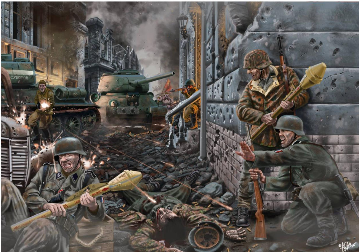
BERLIN BIS ZUM LETZTEN MANN