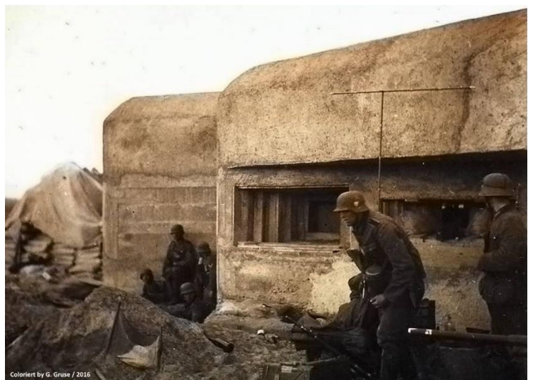
1940 an der französischen Maginot-Linie. Einige Bunker und Stellungen der französischen Panzerfestungen wurden im Nahkampf von deutschen Pionieren ausgeschaltet.

Helmut: Ah ja, wir waren Teil des Hauptangriffs, um die Alliierten in eine Falle zu locken. Wir hatten den Panzer II, den 35(t) [ein in der Tschechoslowakei entwickelter und von Deutschland eingesetzter leichter Panzer] und einige Panzer IV. Wir kamen durch Luxemburg und hatten es hauptsächlich mit Infanterie zu tun, die von den Panzern beiseite geschoben wurde. Wir überquerten die Maas und drangen in den französischen Unterbau ein. Als sie merkten, was sie getroffen hatte, war es schon zu spät. Dieser Angriff war eine Meisterleistung der deutschen Waffen. Die Franzosen brauchten ein paar Tage, um zur Vernunft zu kommen, und zu diesem Zeitpunkt waren ihre Linien aus den Angeln gehoben und gebrochen. Ein