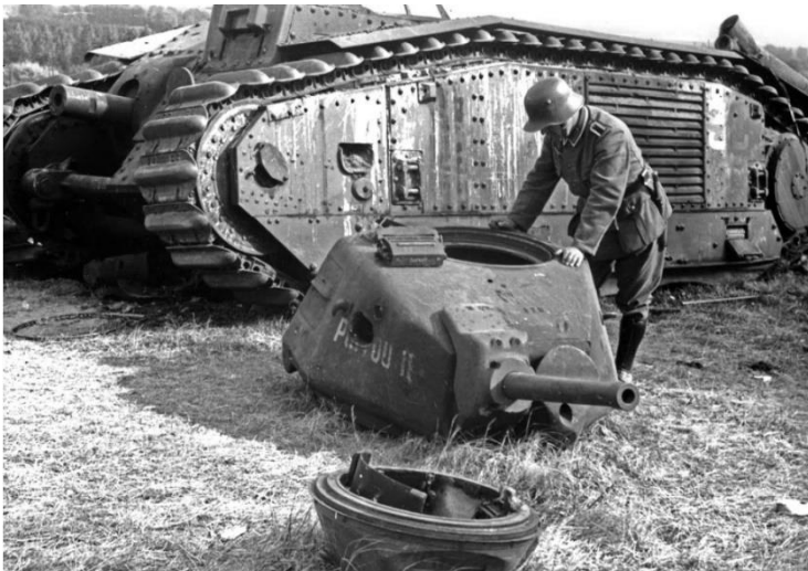
Französischer schwerer Panzer Char B1, der durch eine 88-mm-Granate zerstört und dessen gesamte Besatzung getötet wurde. Dencé, Frankreich, Mai 1940.

zu stimmen. Ich habe Himmler auch später im Krieg gesehen, er war sicherlich eine interessante Person. Ich las während des Krieges einige SS-Publikationen und war von den Forschungen der Ahnenerbe-Gesellschaft und der Archäologen ziemlich fasziniert. Ich bin immer noch fasziniert von den Entdeckungen, die überall auf der Welt gemacht werden. Ich habe mich schon immer für die alte Geschichte und die Zeitlinie der Zivilisationen interessiert. Auch die SS hatte ein großes Interesse daran. Himmler glaubte, er sei die Reinkarnation eines großen Königs. Soweit ich weiß, ging es auch Patton so [Patton glaubte, dass er in früheren Leben oft Soldat gewesen war. Er schrieb darüber sogar ein Gedicht mit dem Titel 'Through a Glass, Darkly'/Durch eine dunkle Brille]. Die SS hatte eine tiefe Ehrfurcht vor unserer Vergangenheit und studierte viele Theorien über den Ursprung des Menschen.