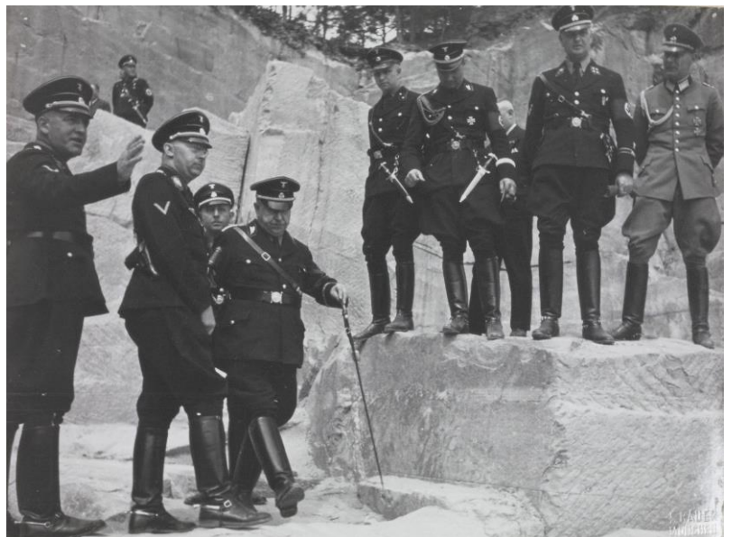
Der 'Reichsführer' SS Himmler und Wiligut (Weisthor) besichtigen 1935 altgermanische Runenzeichen in einem Pfälzer Steinbruch